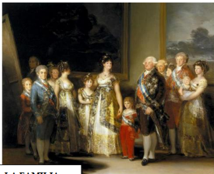
LA FAMILIA DE CARLOS IV