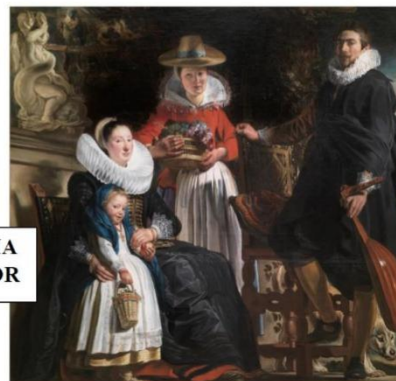
LA FAMILIA DEL PINTOR

El alumno “protagonista” se colocará en medio de la clase frente a sus compañeros. Seguidamente, elegirá un cuadro en secreto. Sus compañeros le harán preguntas que tengan como respuesta si o no, intentando adivinar el cuadro del otro.