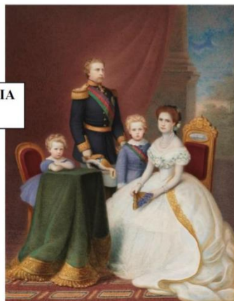
LA FAMILIA REAL